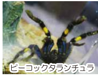
ピーコックタランチュラ

みなさんはクモが好きですか？私はクモに心を奪われ、今では自宅でもタランチュラを飼うまでになりました。