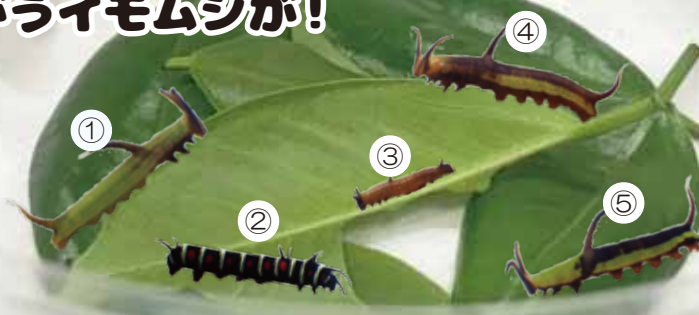
イシガケチョウ (5齢)

僕たちの飼育ケースに、違うイモムシが1匹迷い込んだ。何番のイモムシが違う種類かな? 探してみよう!