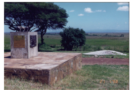
ケニアのサバンナ