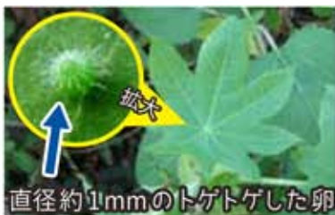
直径約1mmのトゲトゲした卵

2階のテラスにカバタテハの食草「ヒマ」が置いてあります。葉の表面をよく見ると、緑色の小さな卵がついていることがあります。卵にはたくさんの毛のような突起が生えていて、まるで海に棲むウニのように見えます。