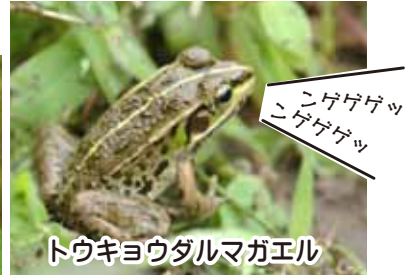
トウキョウダルマガエル

それでも、仕事の帰り道でこの合唱を聞くと、ほっとした気分になってしまうから不思議です。