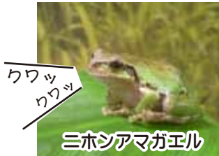
三ホシアマガエル