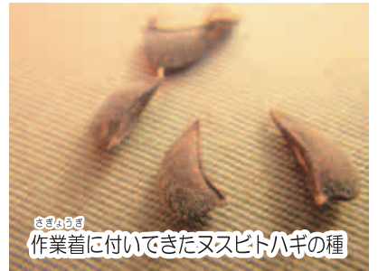
作業着に付いてきたヌスビトハギの種

今年になって動物の飼育から植物の管理の担当になりました。当たり前のことですが「植物も生きてるんだなあ」としみじみ思うようになりました。植物の種類にもよりますが、意外と繊細できちんと管理しないと弱ってしまうものがあります。動物の飼育における水の交換が植物への給水、給餌が肥料を与えることになるのでしょうか。日々話をしていると、植物も様々な工夫をしているんだと感じます。例えば、ヌスビトハギは遠くへ種を送り出す工夫として、種の表面に小さなかき状の毛を生やして動物などにくっつきやすくしています。植物の世界も動物たちと密接に関わっていて、奥深いなあと日々感心させられます。健気に頑張って生きている植物たちを観察すると、様々な生き方が見えて面白いです。