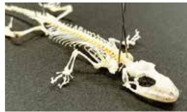
ニホンヤモリの骨格標本

これを見て骨格標本を作れるのではと思い、死んでしまったニホンヤモリで試してみました。体が大きいミルワームは、小骨も食べてしまうので、定期的に小さい幼虫に取り換えるなど工夫をしてみたり、仕上げの工程は骨格標本に詳しい先輩にアドバイスをいただいたりしながら行いました。自分でふと気づいたことから、実際に標本作りを行えたことはとても貴重な体験になりました。