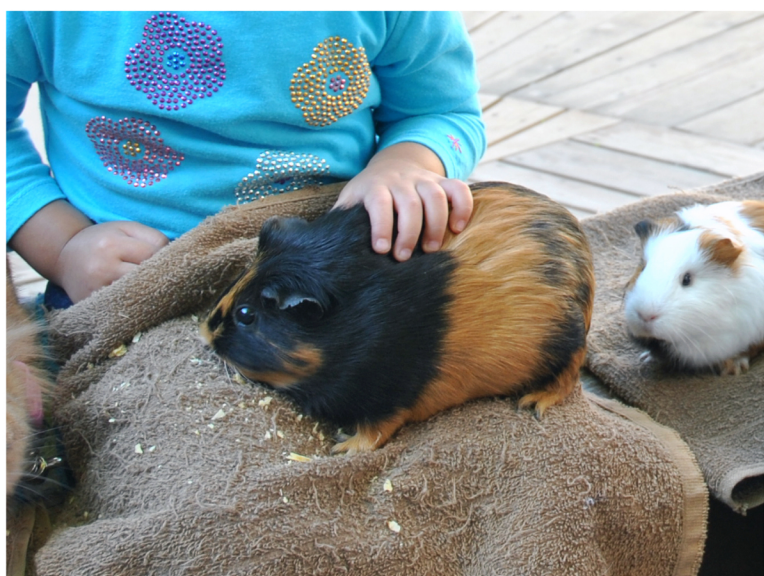
モルモットふれあい