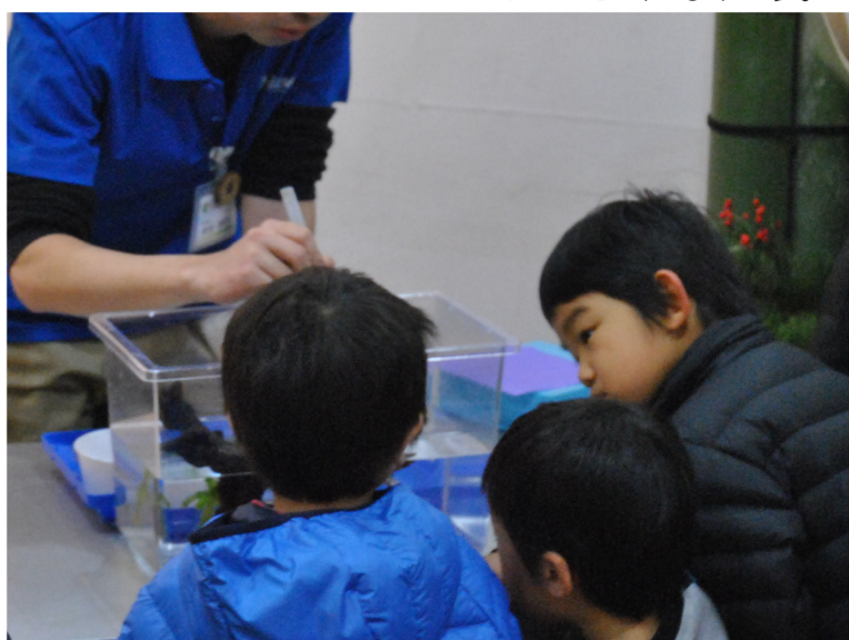
昆虫のエサやりの見学