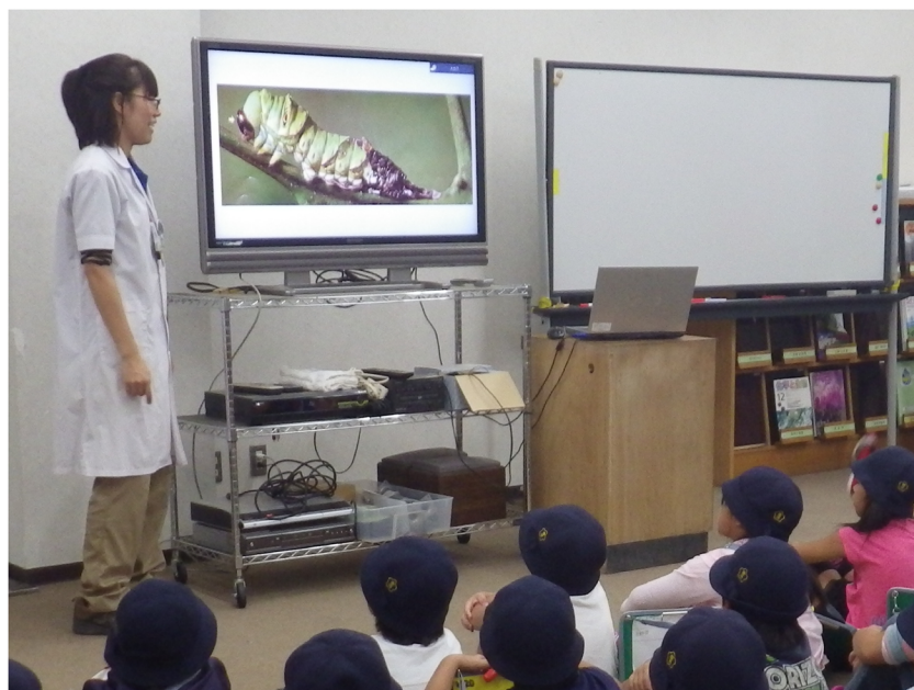
「チョウの一生」について解説受ける