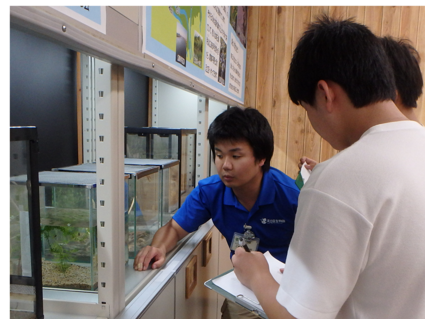
職場体験で昆虫の飼育について話を聞く

キャリア教育のみにとどまる。 中学生・高校生向けの、生物や環境に対する教育プログラムがない。