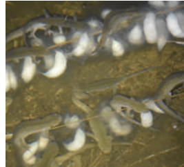
産卵のため集まる成体 白いものが卵のう。袋状の膜の中に卵が入っている

私はクロサンショウウオの観察に夢中で、栃木県の山岳地帯にある水辺に通っています。一番の魅力は彼らの産卵が観られることです。産卵が行なわれるのは気温も下がる夜なのでテントを張って待ちます。20時頃になると水中の枝に登り始め、そこに待っていた複数のオスが集まり、メス