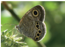
眼状紋が多い個体