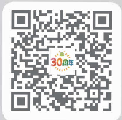
イベント詳細はコチラ