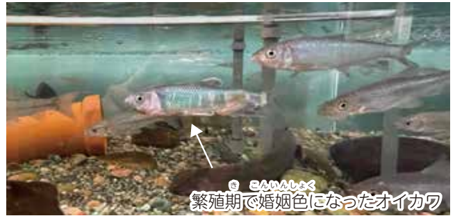
繁殖期で婚姻色になったオイカワ 婚姻色…動物の繁殖期に現れる体の色や模様

繁殖で姿が変化する生きものは4月にも出てきます。色、模様、動き…何かがいつもと違う、そんな瞬間をいっぱい観察して見つけるのもおすすめです。