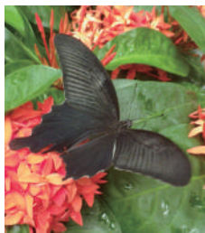
赤い花にもよく訪れます

樹木などが作る日陰の中を好んで飛ぶ習性があるため、あえて日当たりの悪い場所を探すと観察のチャンスが増えます。大温室では1階南側の通路や2階の築山の周辺、庭園ではオーストラリアドーム付近で、活発に飛び回る様子が観察できるので、探してみてください。