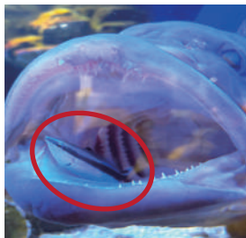
クエの口を掃除をするホンソメワケベラ(赤丸の中)