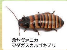
④ヤヴァニカ マダガスカルゴキブリ