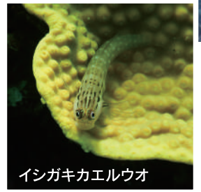
イシガキカエルウオ