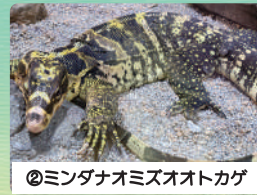
②ミンダナオミズオトカゲ