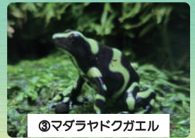
③マダラヤドクガエル